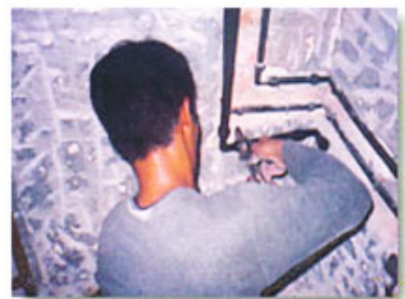
การติดตั้งบริเวณผนังคอนกรีตเสริมเหล็ก