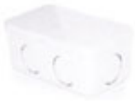
กล่องพักสายสี่เหลี่ยม 4"x2" ร้อยสาย ขาว 15-18-20 มม. (3/8"-1/2"-3/4")