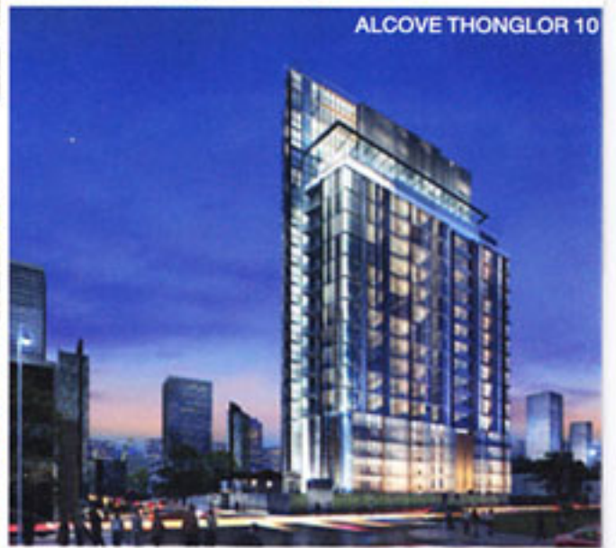
ALCOVE THONGLOR 10