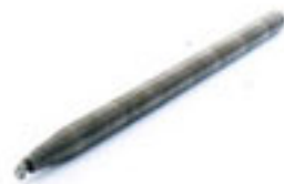
สปริงตัดท่อร้อยสายไฟสีขาว 15-25 มม. (3/8"-1")