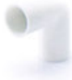
ข้องอ 90° ร้อยสาย ขาว 18-25 มม. (1/2"-1")