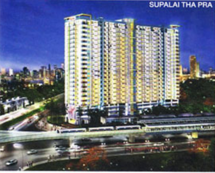
SUPALAI THA PRA