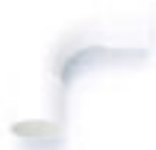
ข้อโค้ง 90° H ช่างเส้น ES2 ร้อยสาย ขาว 15-55 มม. (3/8"-2")