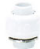
ข้อต่อท่ออ่อนหลายลูกฟูก ขาว 15-25 มม. (3/8"-1")